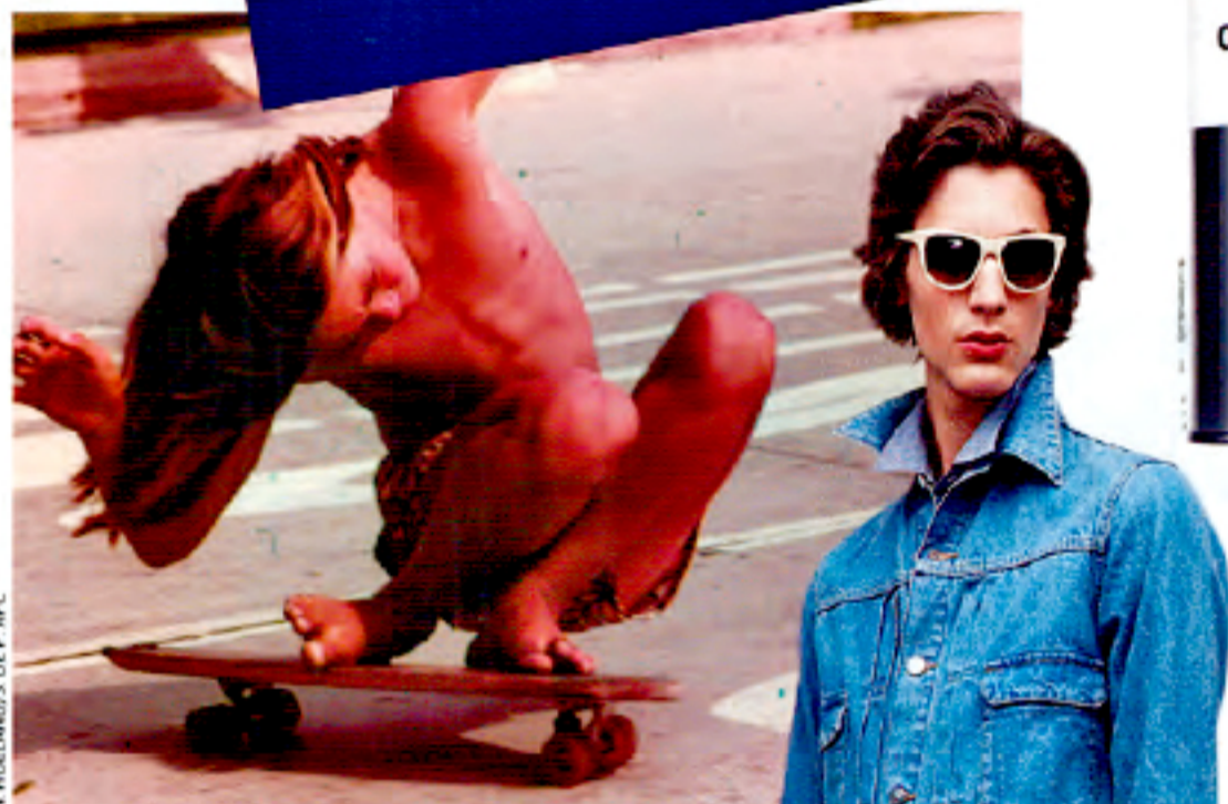
De haut en bas : un tee-shirt du groupe français Housse de racket, 30 €; une photo de skater de Hugh Holland; l'huile d'olive APC; blouson et jean délavé, 180 et 130 €; une affiche de l'Atelier de la petite enfance.

Propos recueillis par Anne-Laure Quillieriet